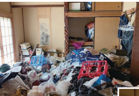
松野さんがお伺いしたお宅。 Before(上)とAfter(下)