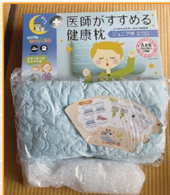
医師がすすめる健康枕(ジュニア用) 「おやすみcopilo」