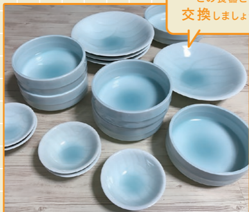
この食器と交換しましょう!