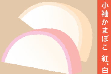
小袖かまぼこ紅、白

「まめ」は丈夫・健康を意味する言葉。「まめに働く」などの語呂合わせからも、おせちには欠かせない料理です。